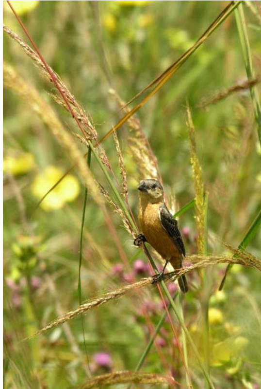
Caboclinho-de-barriga-vermelha ( Sporophila hypoxantha ). Foto: Márcio Repennig