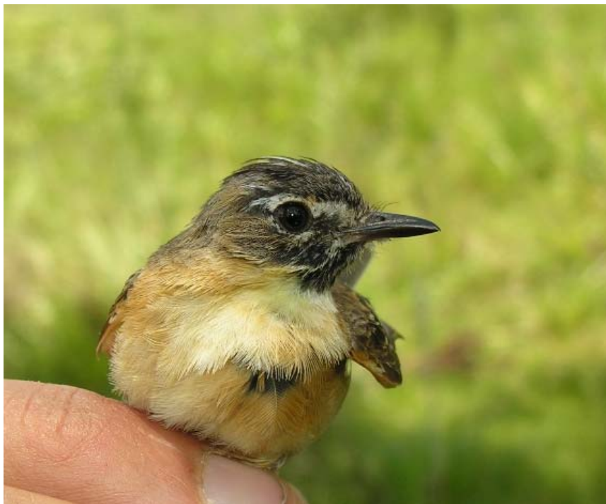
Papa-moscas-canela ( Polystictus pectoralis ).