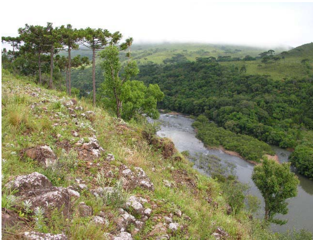
Vista do rio Lava-Tudo, campos naturais e mata ciliar, São Joaquim - Lages/SC.