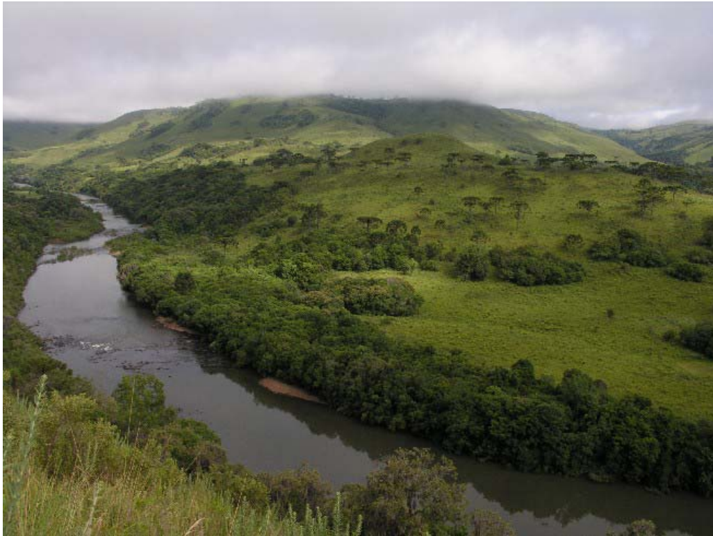
Vale do rio Lava-Tudo São Joaquim - Lages/SC.