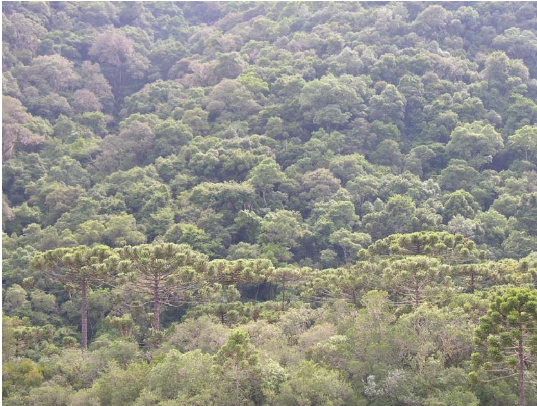
Floresta com araucárias às margens do Rio dos Touros, Bom Jesus/RS.