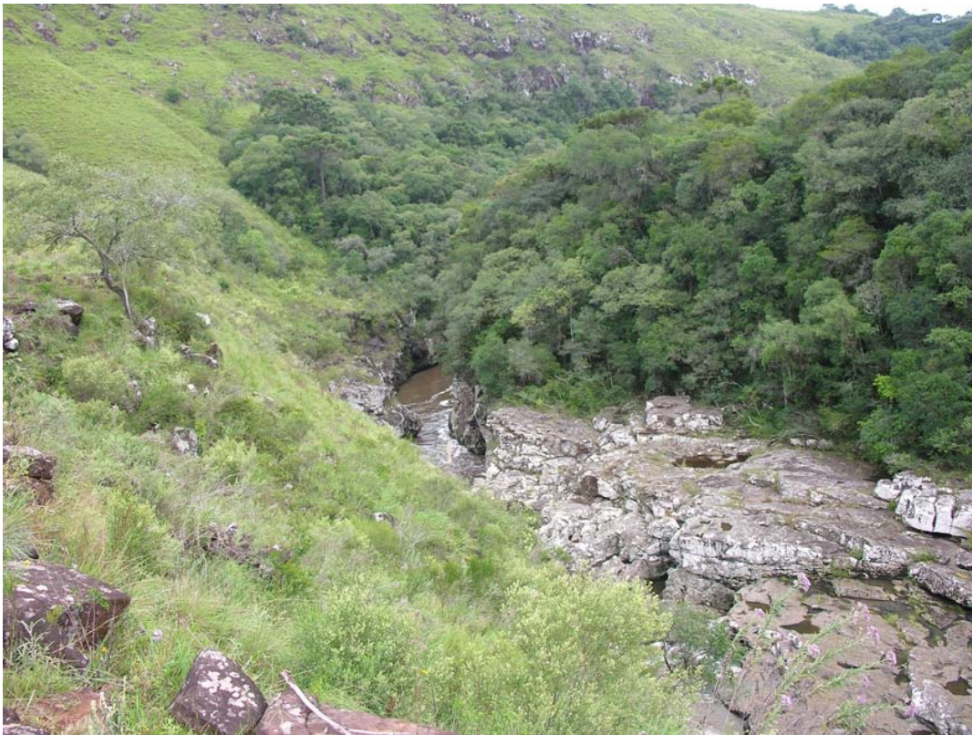
Corredeiras no Rio dos Touros, Bom Jesus/RS.