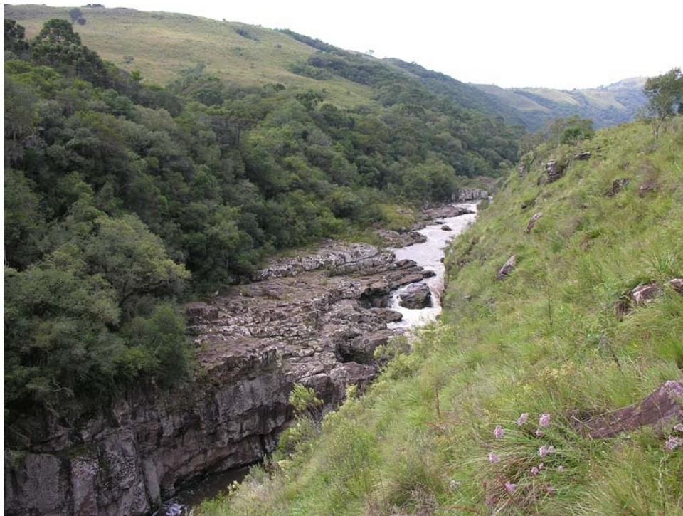
Vista do Rio dos Touros, Bom Jesus/RS.