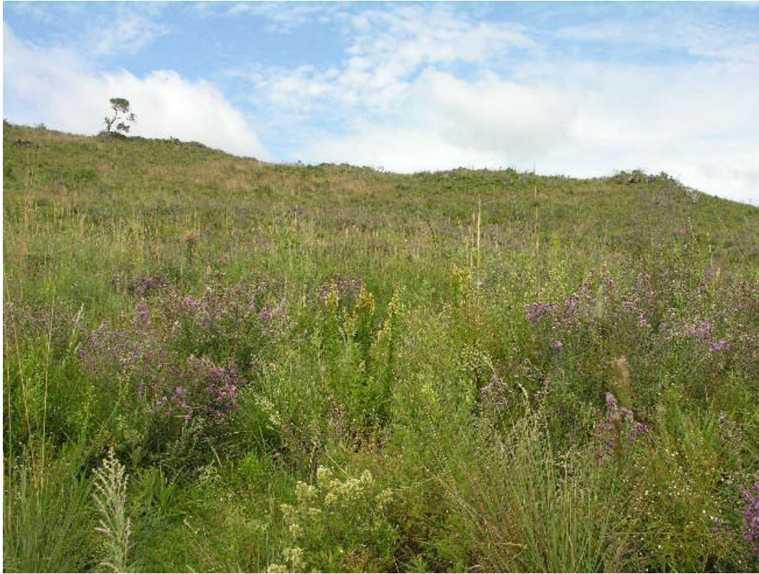
Vista dos campos naturais junto à costa do rio Pelotas, Bom Jesus/RS. Hábitat característico de muitas aves campestres ameaçadas de extinção.