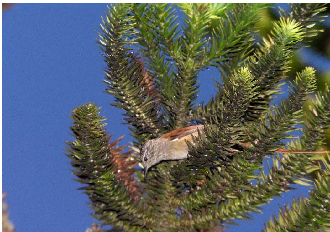
Grimpeiro ( Leptasthenura setaria ).