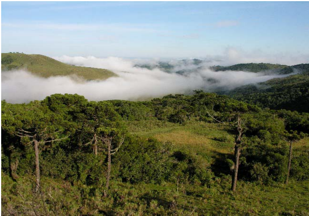
Vista do vale do rio Pelotas próximo ao Rio dos Touros, Bom Jesus/RS. Área onde foram registrados o gavião-de-penacho, urubu-rei e águia-chilena.