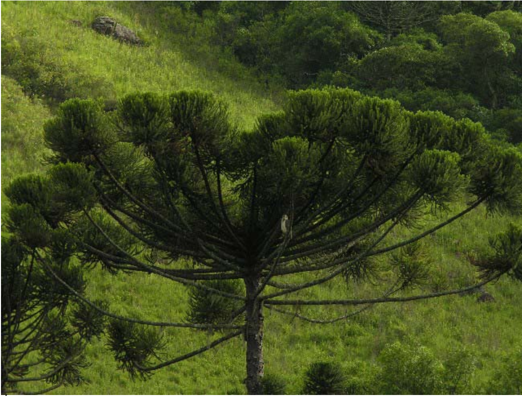
Águia-cinzenta ( Harpyhaliaetus coronatus ).