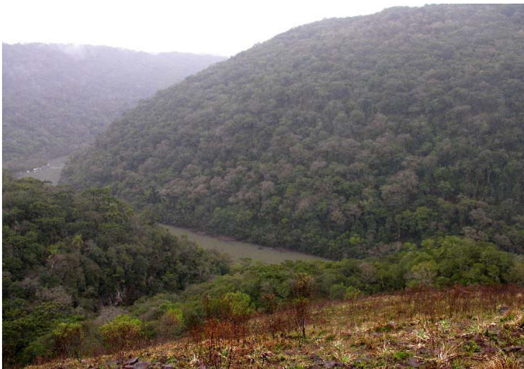
Vista do rio Pelotas, local previsto para construção do muro da UHE Pai-Querê, Bom Jesus/RS e Lages/SC – 07/09/2006.