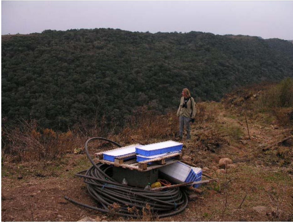
Area onde foi flagrada a inspeção geológica. Exatamente no muro da Barragem, Bom Jesus/RS e Lages/SC – 07/09/2006.