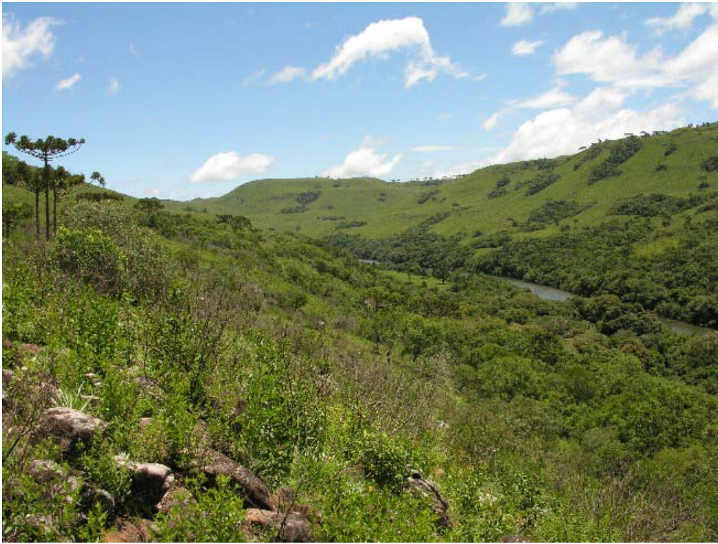
Vista dos campos de altitude do vale do rio Lava-Tudo, São Joaquim - Lages/SC.