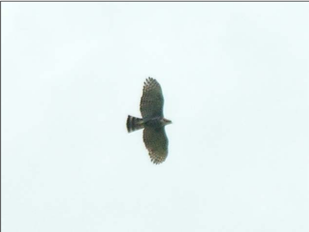
Gavião-de-penacho ( Spizaetus ornatus ).