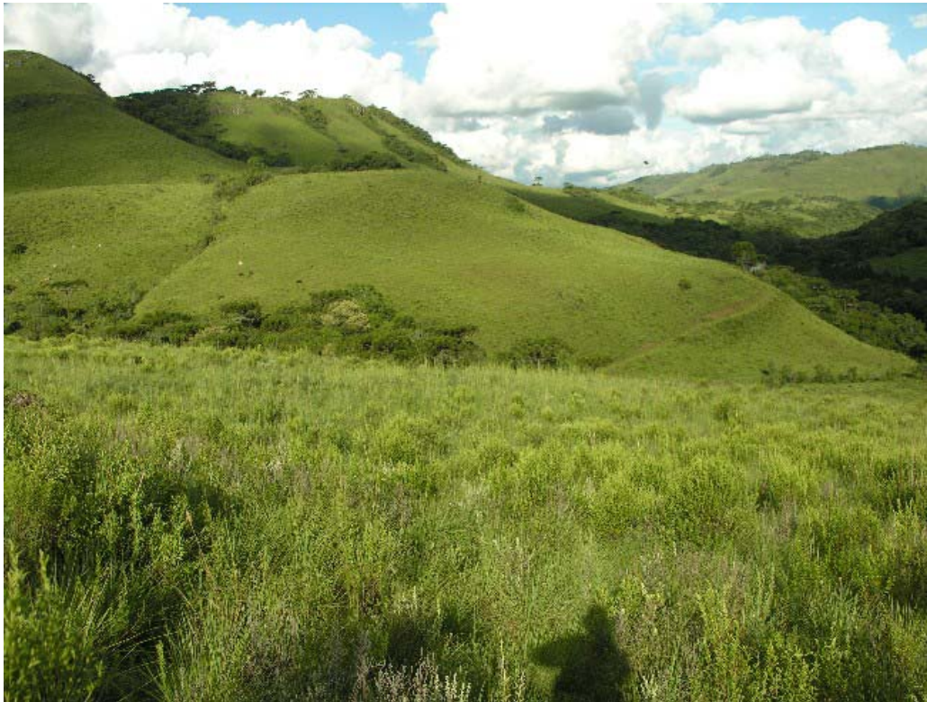
Vista dos campos de altitude próximos da foz do rio São Mateus com rio Lava-Tudo, Lages/SC.