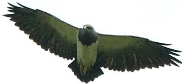
Águia-chilena ( Buteo melanoleucus ).