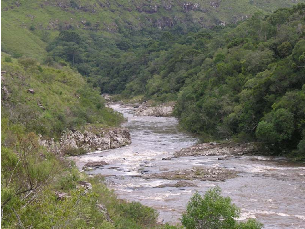
Corredeiras no Rio dos Touros, Bom Jesus/RS.