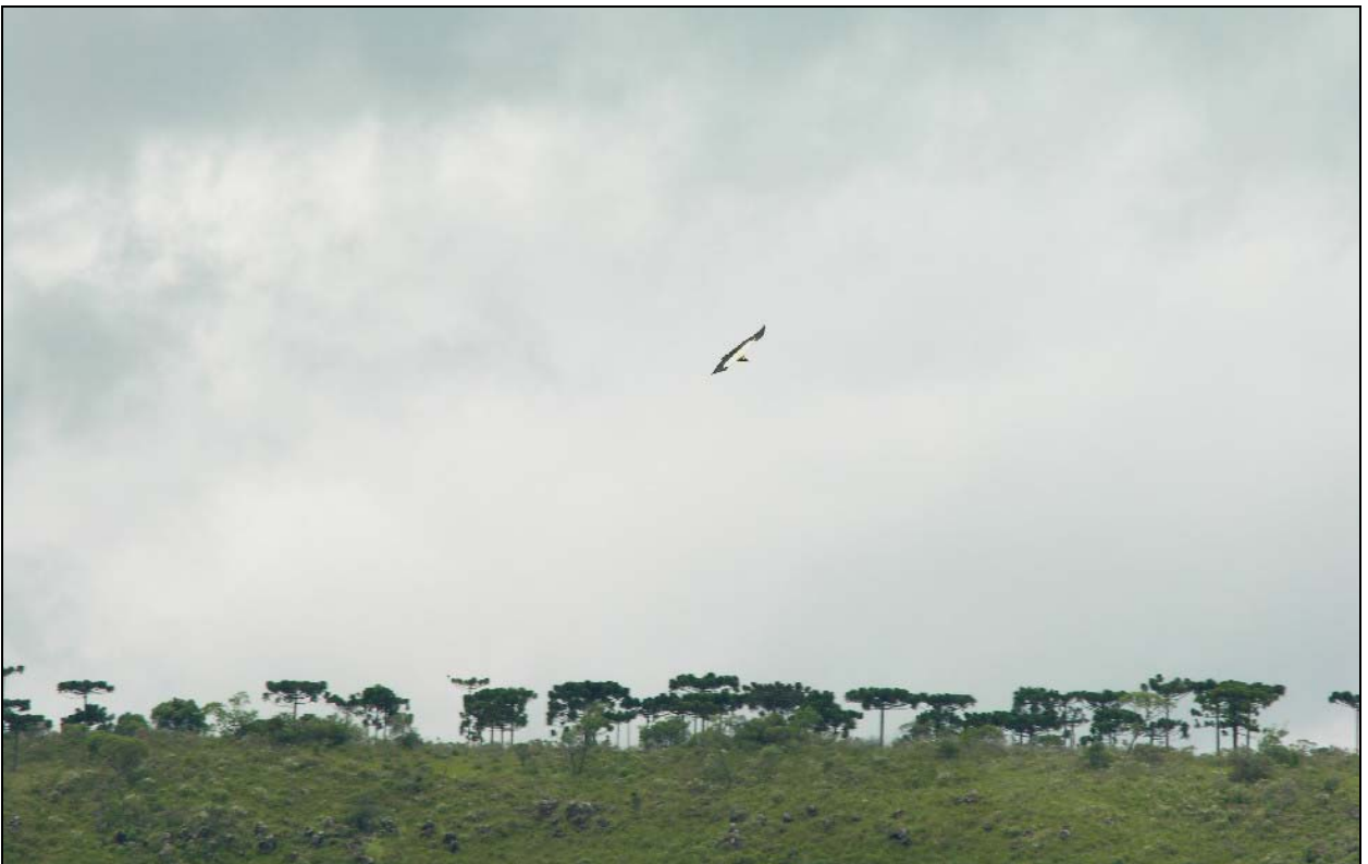
Urubu-rei ( Sarcoramphus papa ).