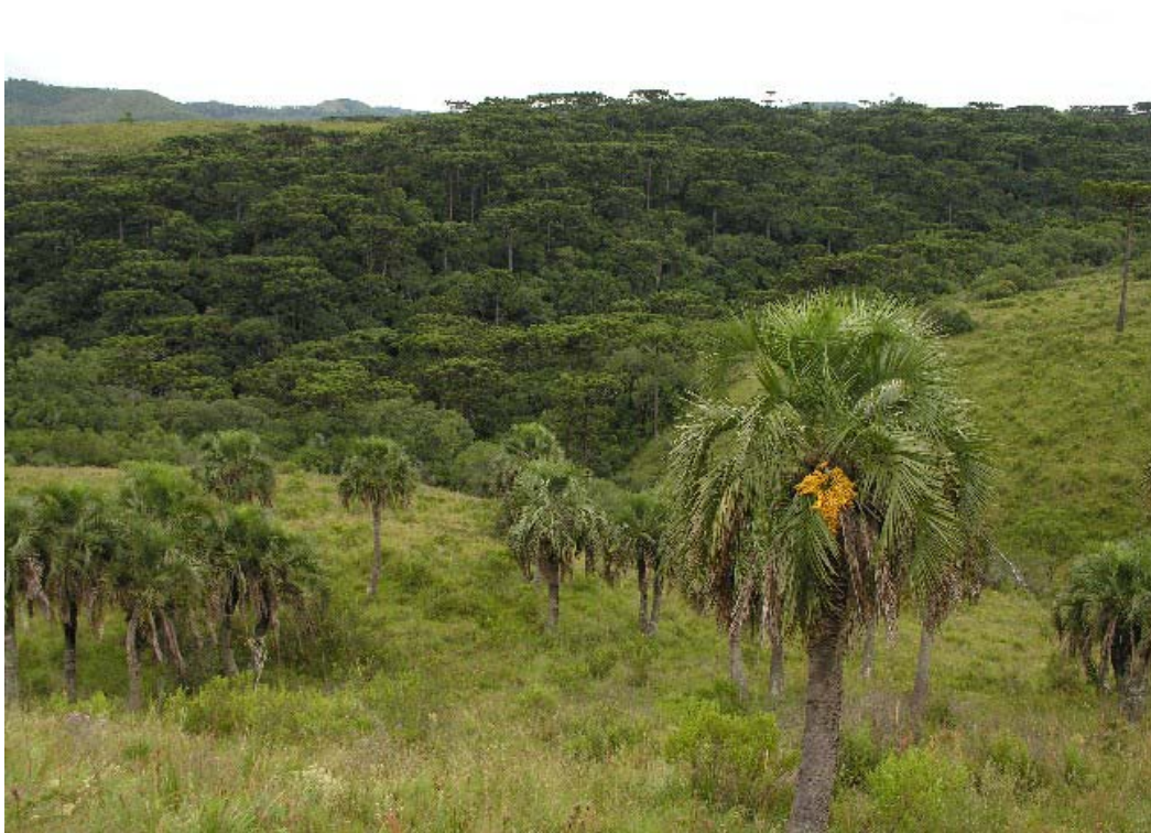
Butiás-da-serra e matas com araucárias ao fundo. Localidade junto ao vale do rio Pelotas, Bom Jesus/RS.