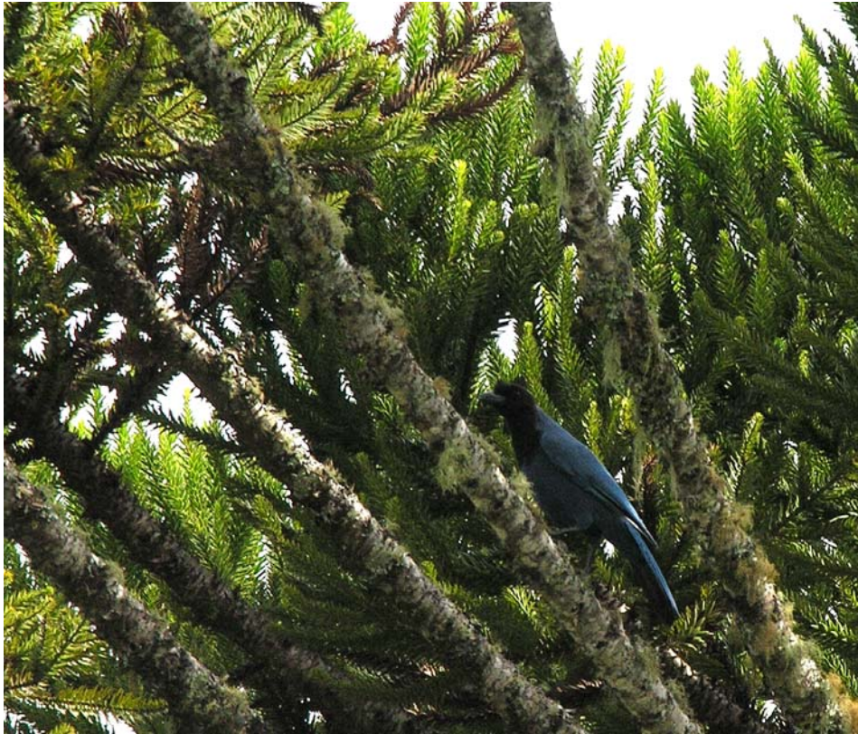
Gralha-azul ( Cyanocorax caeruleus ).

Fotos de algumas espécies de aves que ocorrem em locais atingidos diretamente pelas obras ou pela inundação, caso seja construída a UHE Pai-Querê