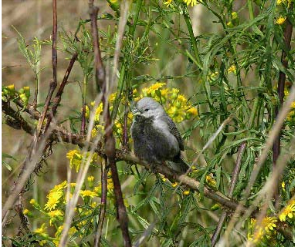
Caboclinho-de-barriga-preta ( Sporophila melanogaster ).