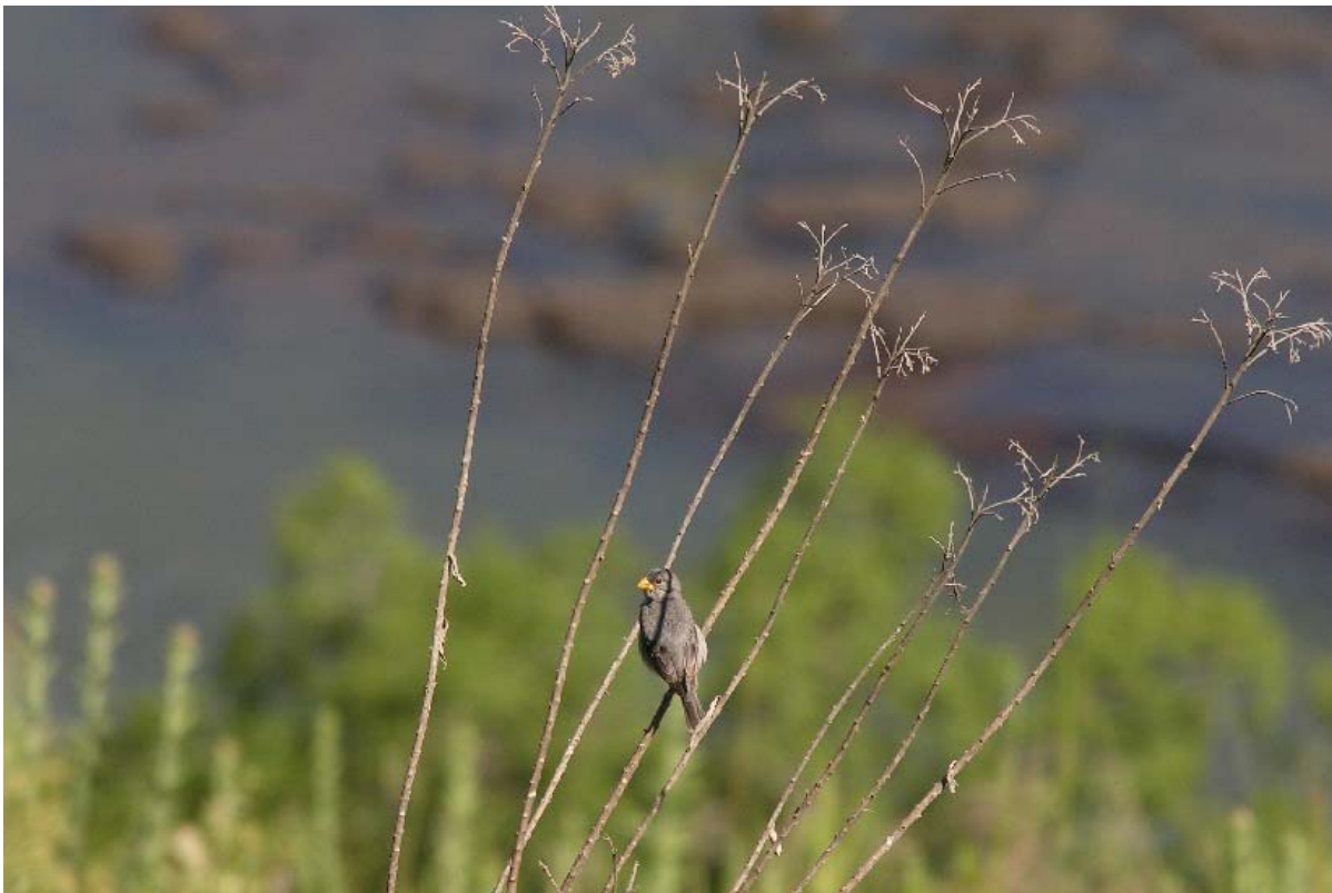
Patativa ( Sporophila plumbea ). Ao fundo, rio Lava-Tudo, São Joaquim – Lages/SC.