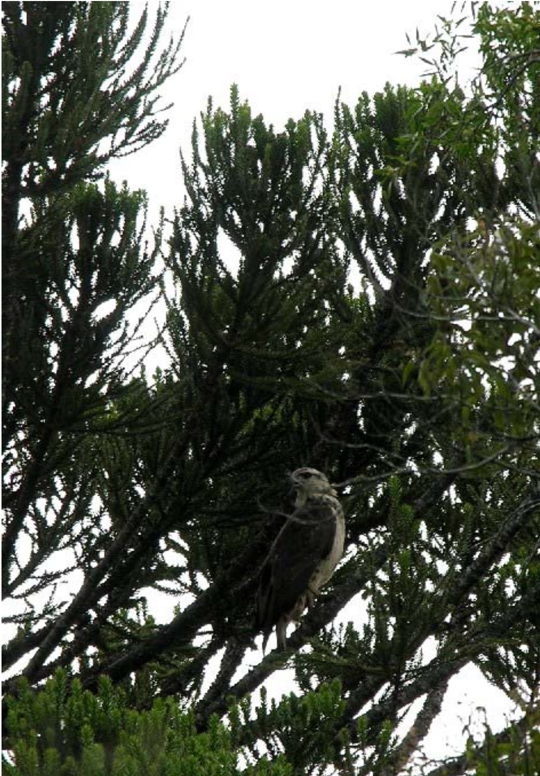
Aguia-cinzenta ( Harpyhaliaetus coronatus ).