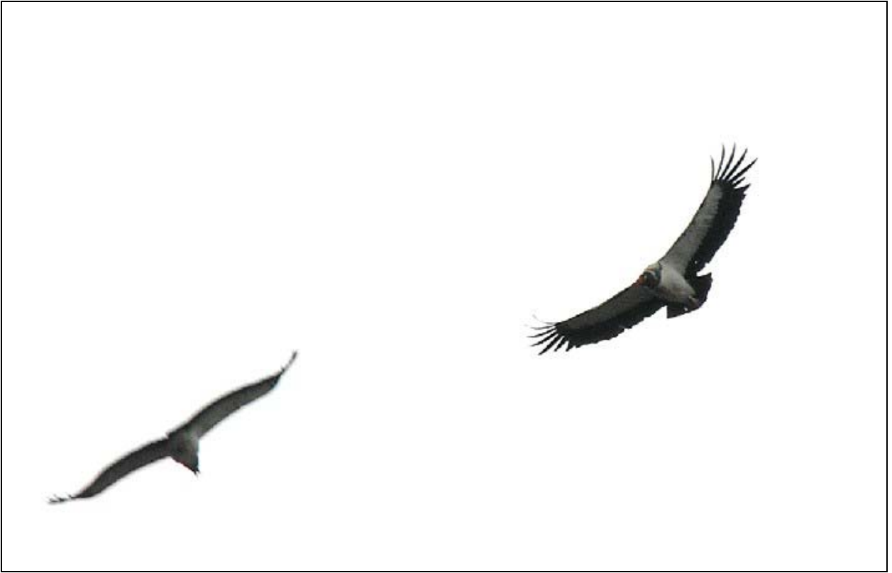
Urubu-rei ( Sarcoramphus papa ).