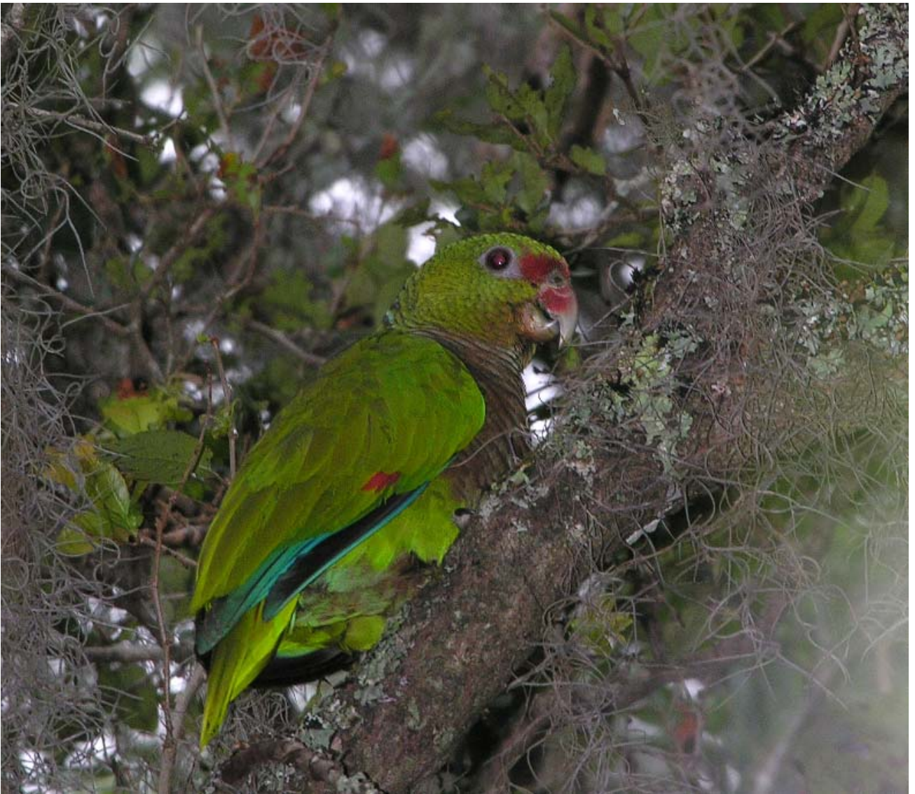
Papagaio-do-peito-roxo ( Amazona vinacea ).