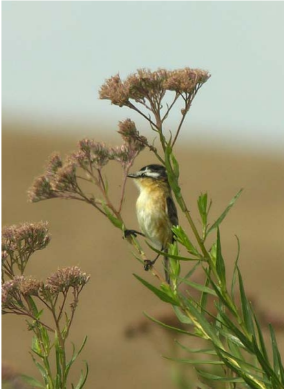
Papa-moscas-do-campo ( Culicivora caudacuta ).