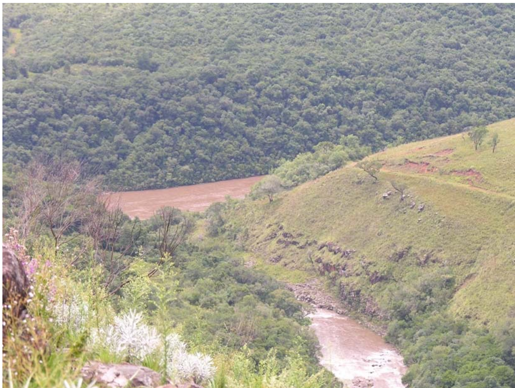
Foz do Rio dos Touros no rio Pelotas, Bom Jesus/RS.