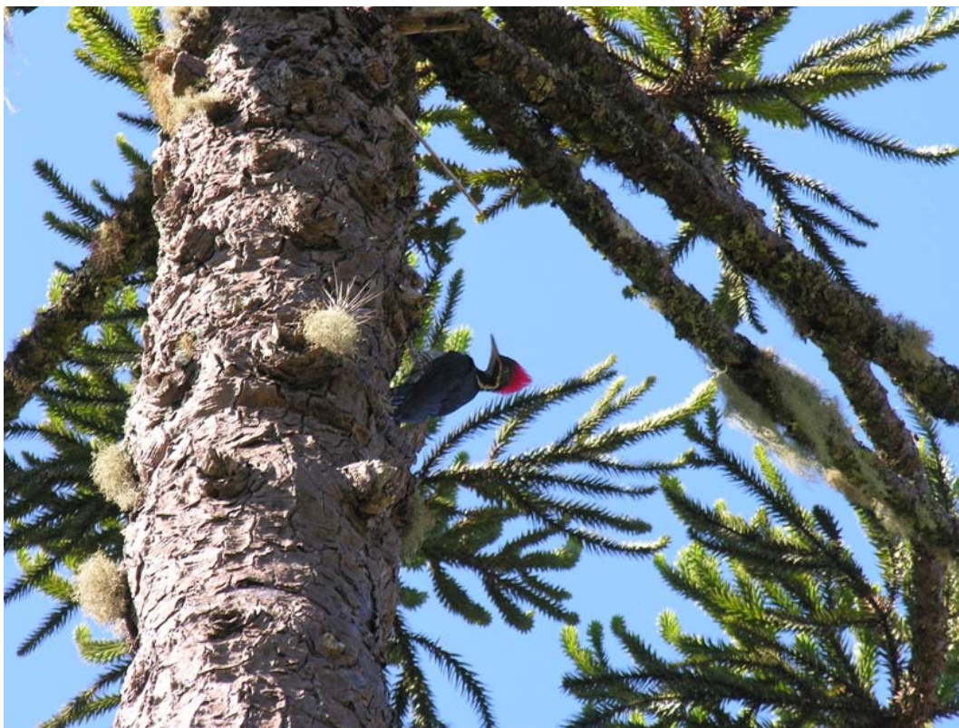
Pica-pau-de-banda-branca ( Dryocopus lineatus ).