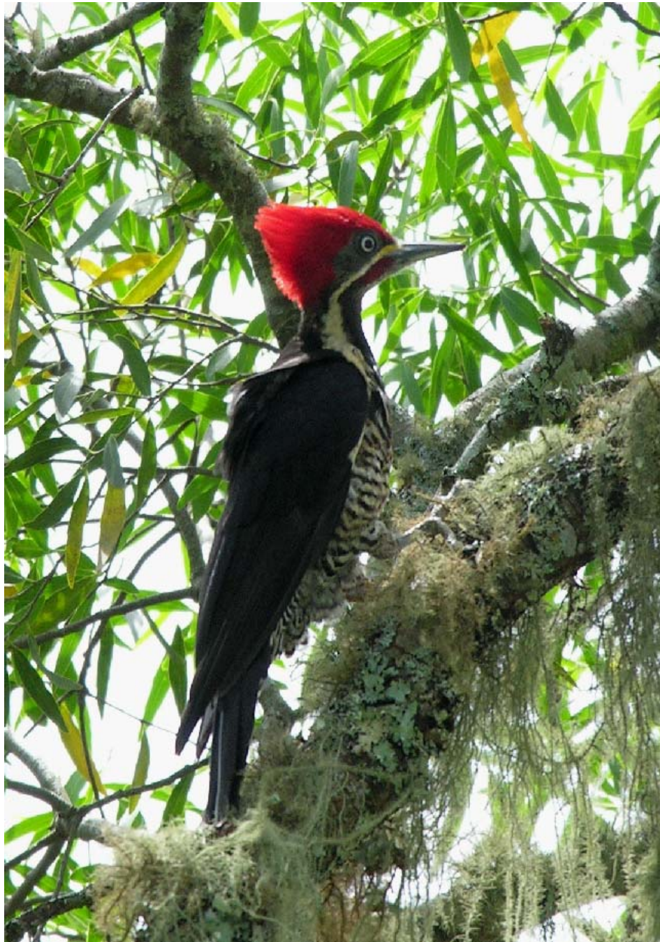
Pica-pau-de-banda-branca ( Dryocopus lineatus ).