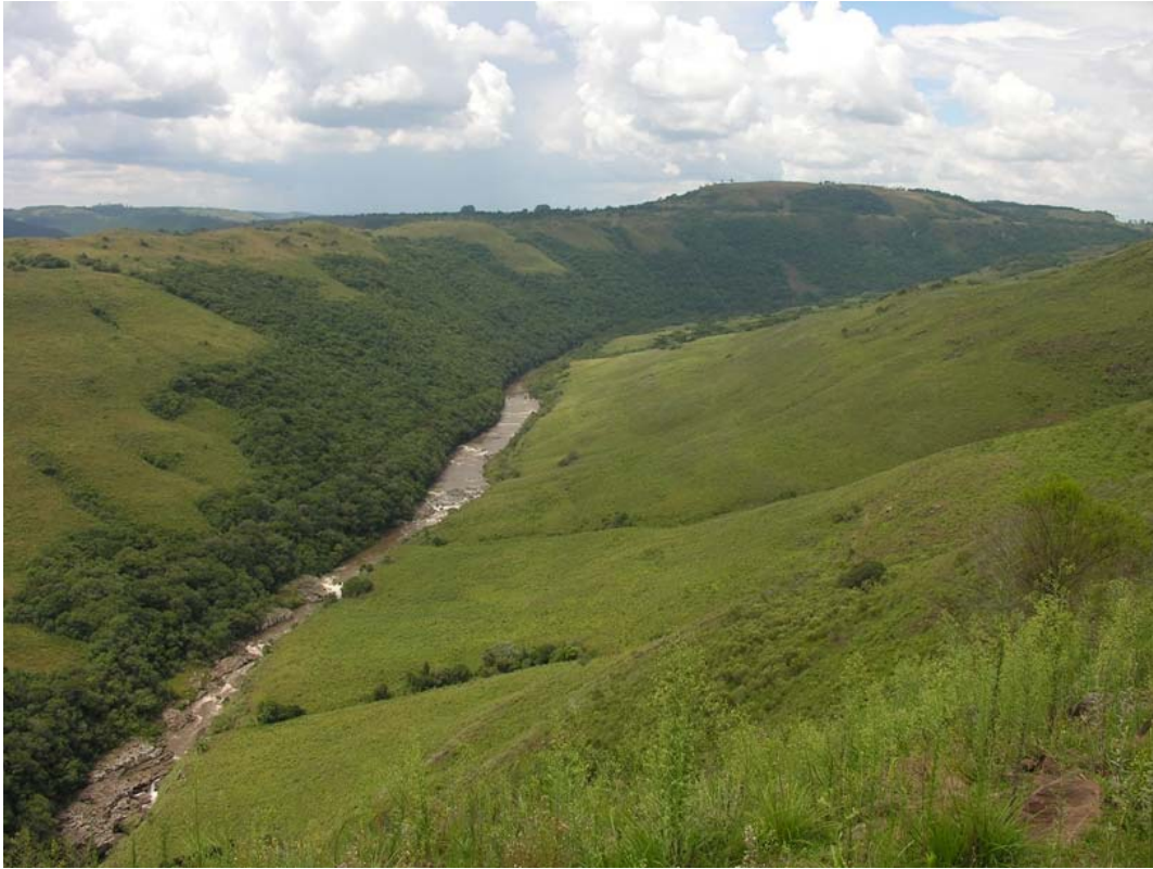
Vista ampla da calha do Rio dos Touros, Bom Jesus/RS.