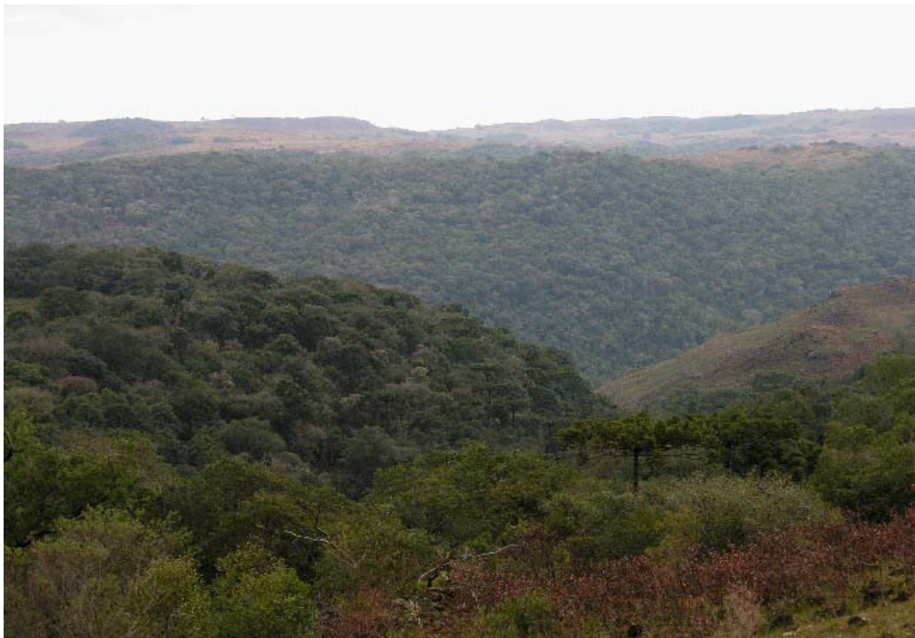
Vista para o vale do rio Pelotas, local previsto para o empreendimento, Bom Jesus/RS e Lages/SC – 07/09/2006.