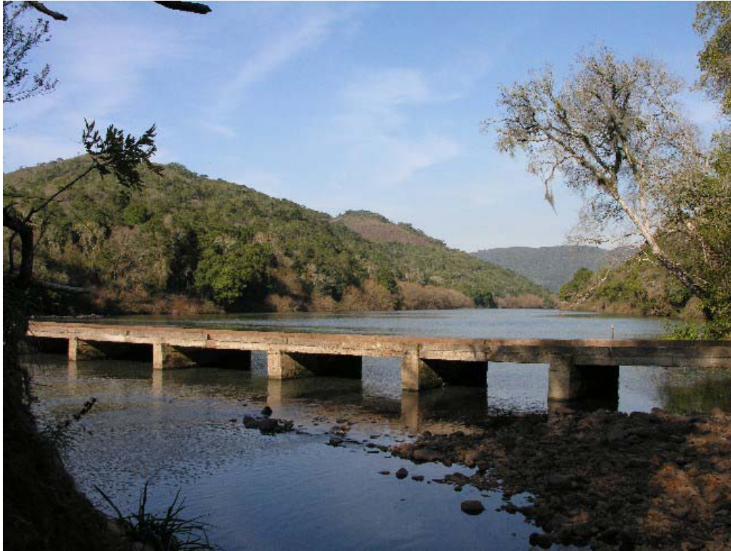
Vista rio Pelotas foz do rio Cerquinha Bom Jesus/RS e São Joaquim/SC.