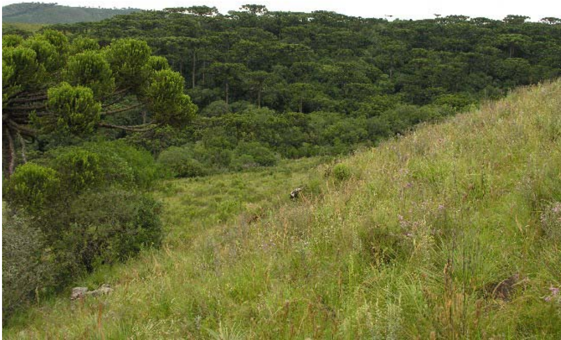
Vista campo e mata com dossel dominado por araucárias junto ao encontro do rio dos Touros com rio Pelotas, Bom Jesus/RS.