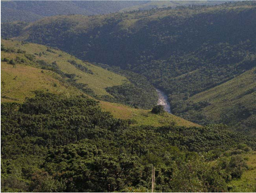
Vista do Rio dos Touros próximo à foz com rio Pelotas, Bom Jesus/RS.